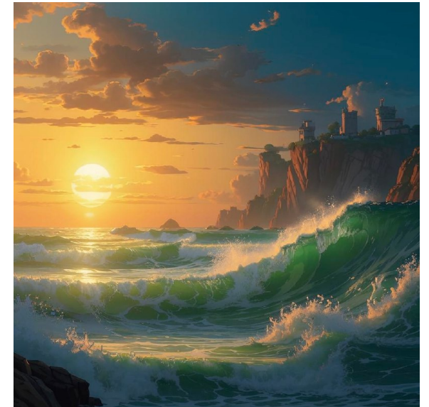
Kandinsky by Sber AI

www.rbc.ru/economics/29/05/2024/66563cd29a79471f91d4299 www.rbc.ru/economics/28/05/2024/6655ca2f9a7947288f47d6a6