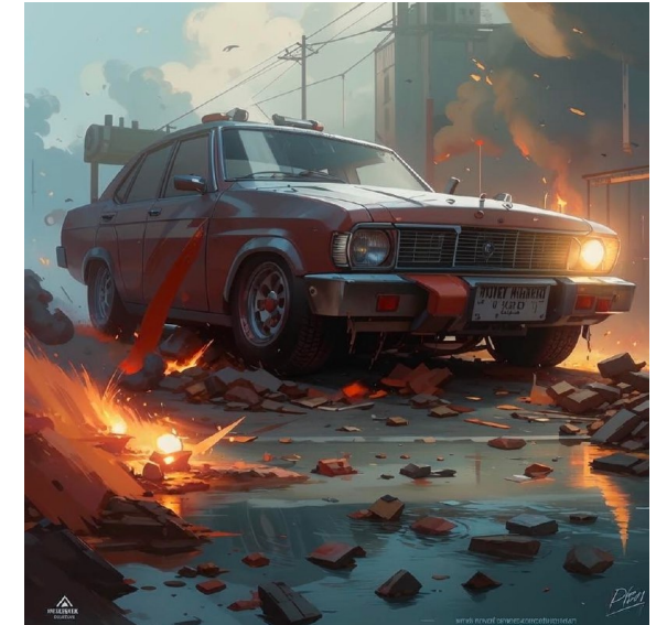
Kandinsky by Sber AI