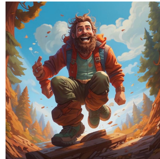
Kandinsky by Sber AI

«ФНС России до конца года должен быть подготовлен порядок представления налогоплательщиком заявления для получения налоговых вычетов на долгосрочные сбережения граждан по ИИС, заключенным до 31 декабря 2023 года», — сообщили «РБК Инвестициям» в пресс-службе Минфина России, добавив, что предметных предложений от профучастников о том, как должна работать конвертация, не поступало.