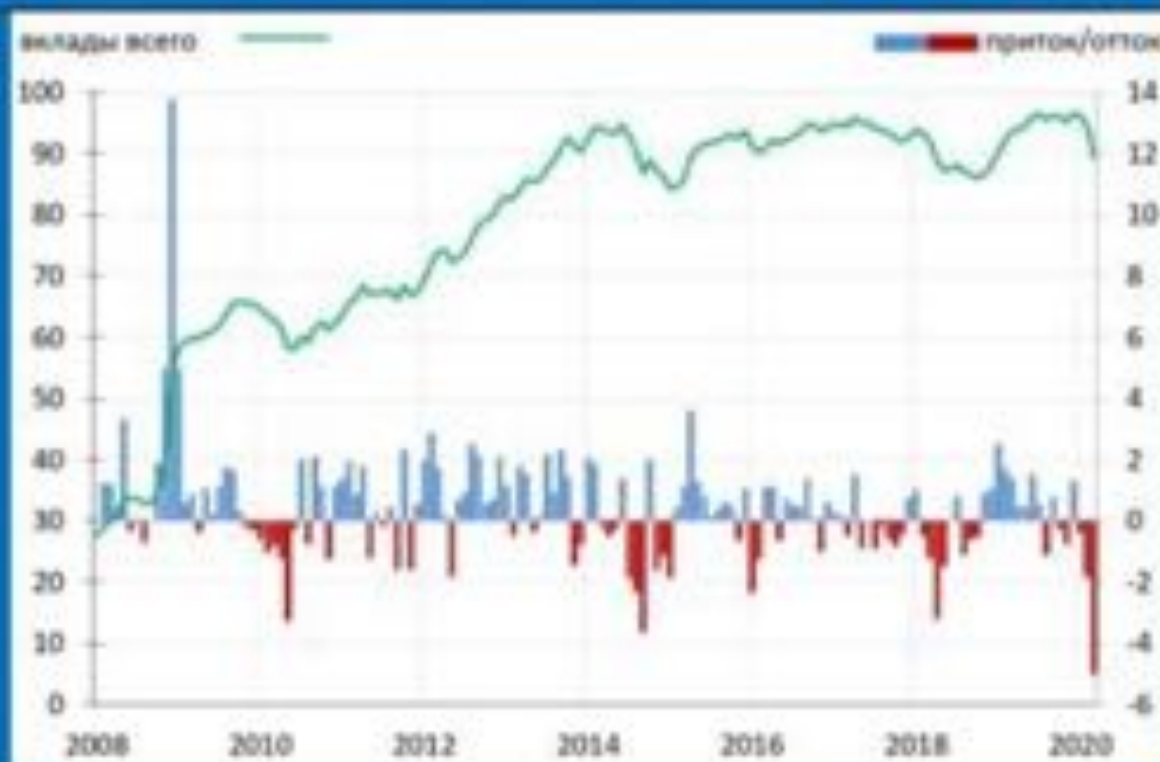
Валютные депозиты, $млрд